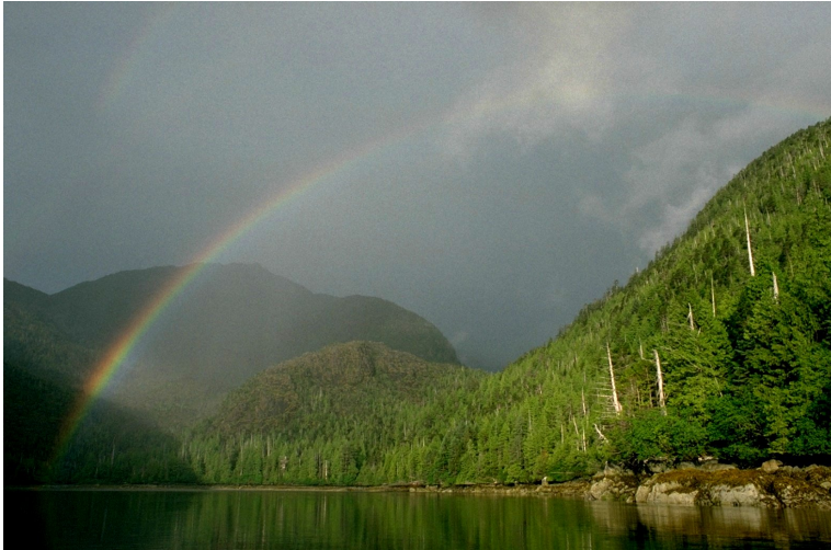
Haïda Gwaii, un laboratoire grandeur nature - © Mille et une productions