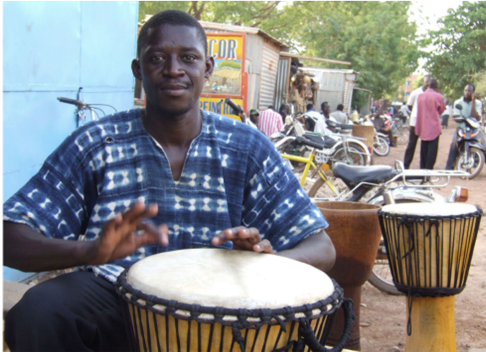
Lieux saints