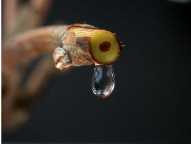
Du bourgeon au raisin