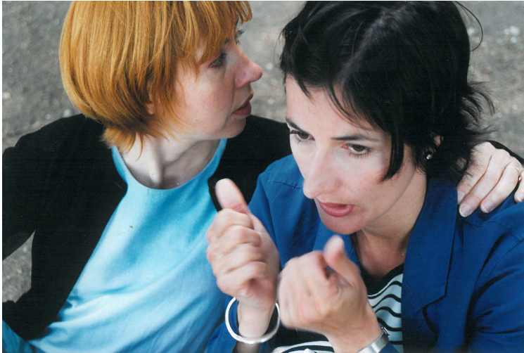
La Mère - © Clotilde Verriès