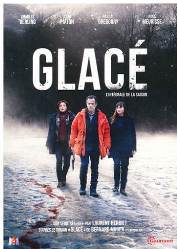
Glacé - Affiche de la série