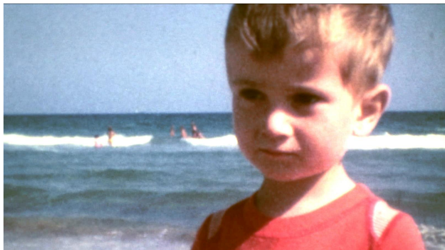
Le Remords