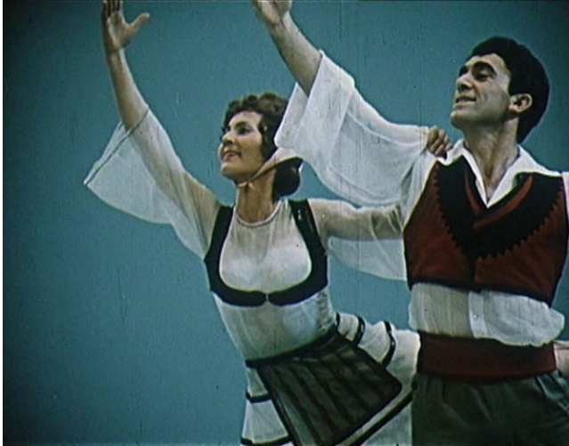
Le Kinostudio - Photo du film