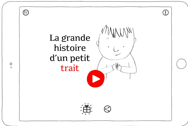
La Grande Histoire d'un petit trait - Photo du film