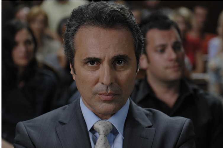
L'Avocat - © Sunrise films 2009 - Photo Anne Harnie-Cousseau