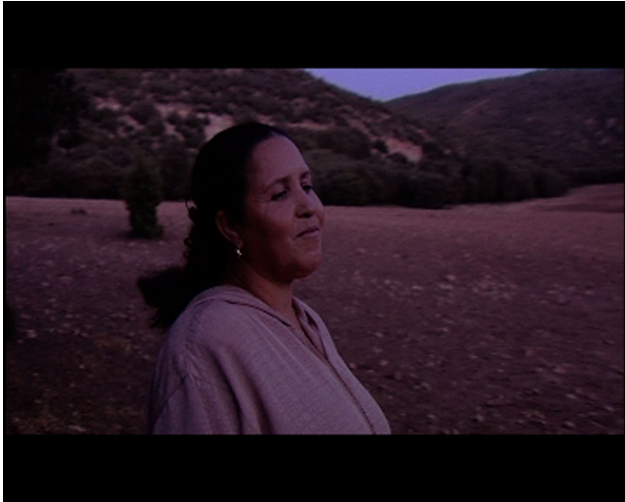
Les Filles de la lune - © Antéa