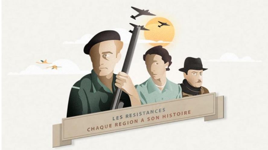
Photo extraite du web-documentaire Les Résistances