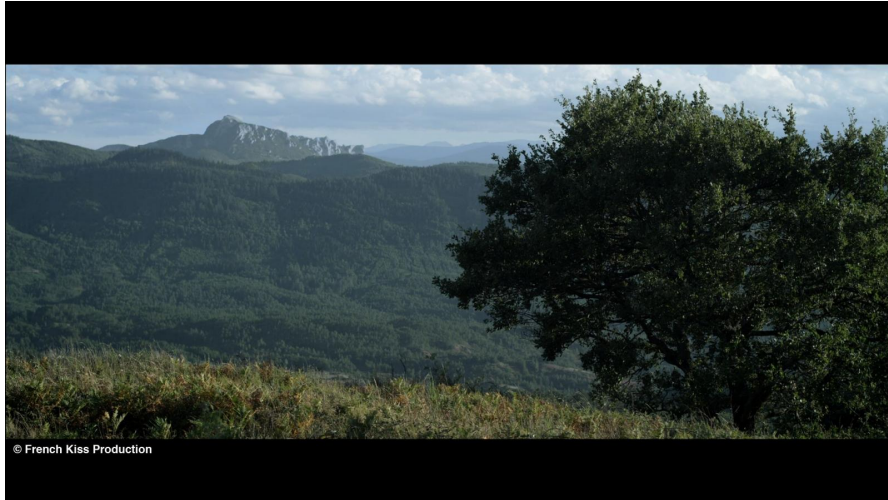
Là où les dieux nous touchent. Photo du film de Giulia Grossmann