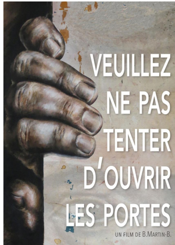
Affiche du film Veillez ne pas tenter d'ouvrir les portes