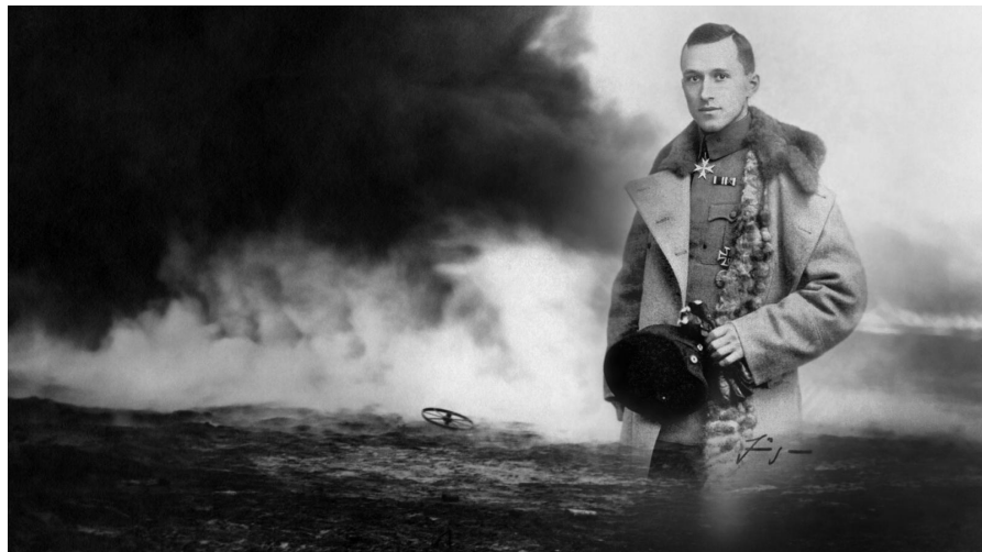
Le Rouge et le Gris – Ernst Jünger dans la Grande Guerre