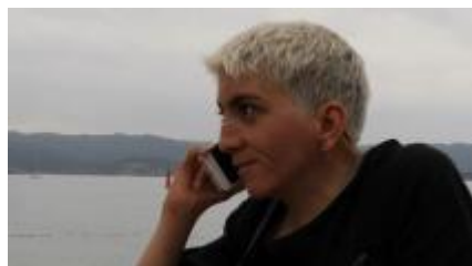
Mimi, un film de Laure Pradal