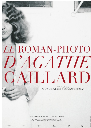
Affiche du film Le roman-photo d'Agathe Gaillard