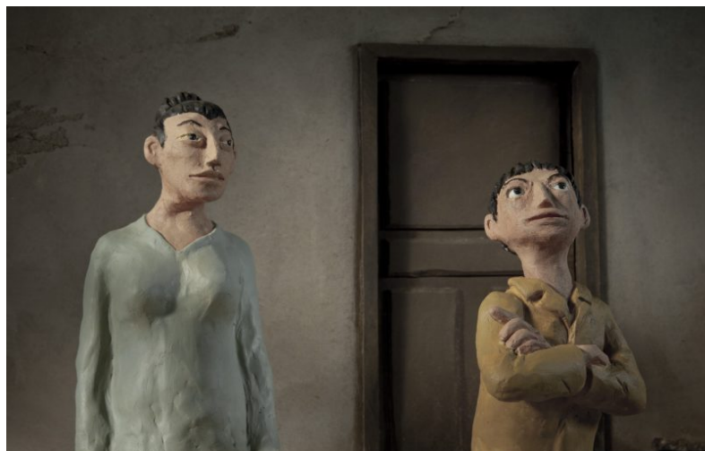
Boléro Paprika, un film de Marc Ménager