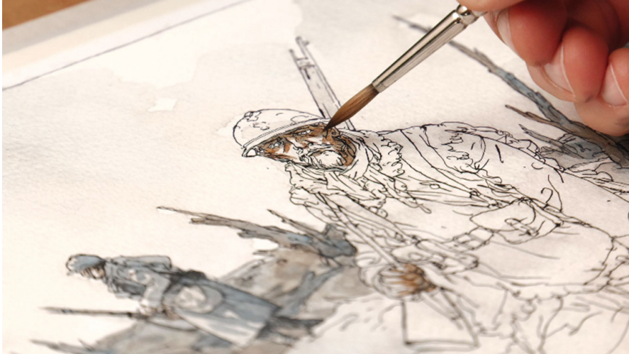
Là où poussent les coquelicots - © Kanari Films