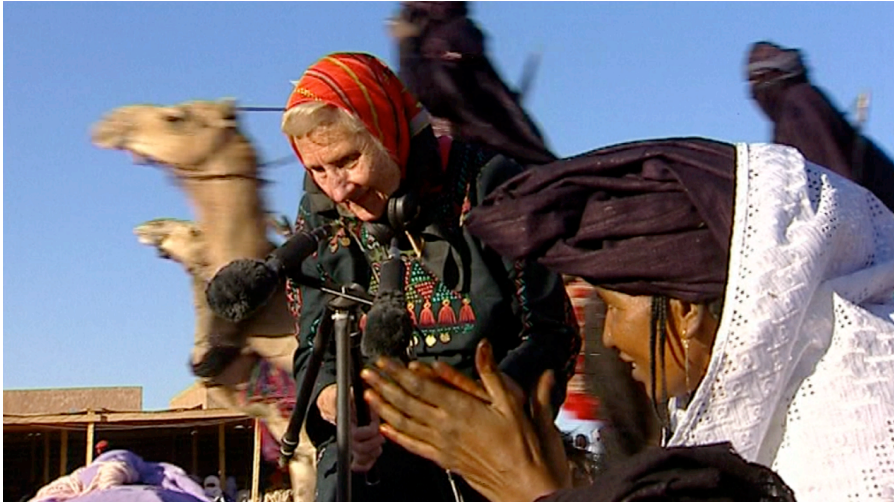
Musiques du désert