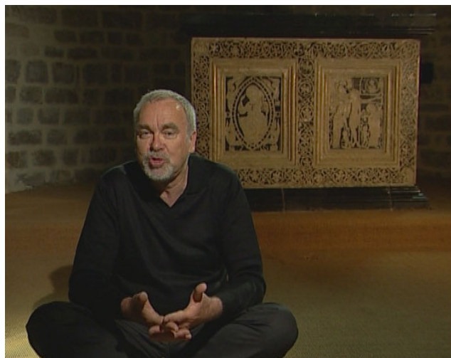
Mosaïca - © Mille et une productions