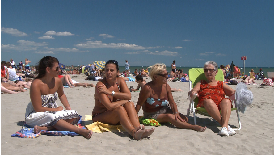
Parasols et Crustacés