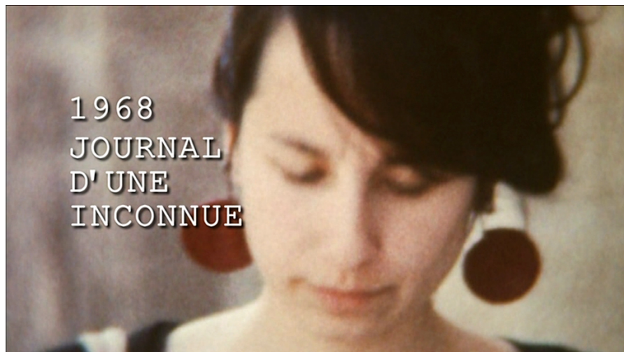
1968, journal d'une inconnue