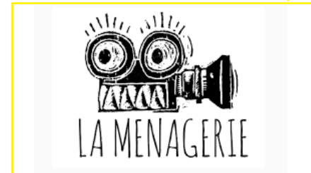
LA MÉNAGERIE Studio d'animation